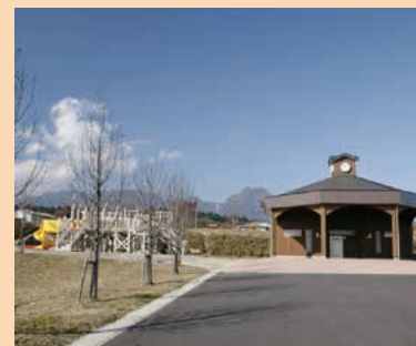
■上野田ふれあい公園 MAP E-3

夜間照明を備えたテニスコート2面（ハードコート）。野球やサッカーなどさまざまなスポーツに利用できる屋外運動場も併設されています。