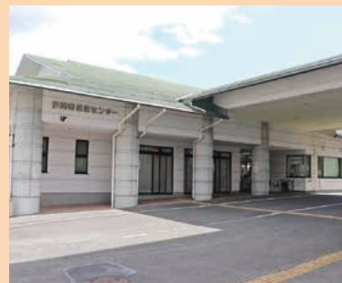
■保健センター MAP H-4

総合的な保健サービスを行い、町民の健康増進の拠点やふれあいの場として利用されています。