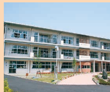
■駒寄小学校 MAP I-5

大規模校ですが、細やかな指導や高学年学級の副担任制など特色ある学校づくりを目指しています。