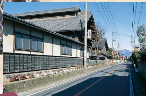
■大久保宿養蚕農家群 MAP I-6