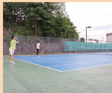
■八幡山公園テニスコート MAP H-4

ケイマンゴルフ場、パークゴルフ場、グラウンドゴルフ場があり、年齢や体力に応じて楽しむことができます。