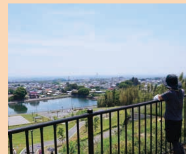
■城山みはらし公園 MAP F-5

子どもからお年寄りまで幅広い年齢層の方が、スポーツやレクリエーションの場として利用できます。