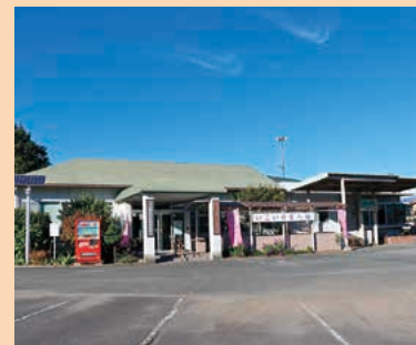
■老人福祉センター MAP H-5

総合的な保健サービスを行い、町民の健康増進の拠点やふれあいの場として利用されています。