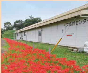
■文化財センター MAP G-5