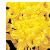
町の花 ■ きく

めぐまれた自然と、輝かしい歴史と伝統にはぐまれたわたくしたちは、平和で心豊かな生活を願い、吉岡町民としての自覚に基づき、ここにこの憲章を定めます。 一、体をきたえ、健康で明るい家庭をつくりましょう。 一、働く喜びを知り、技術のみがき、町の発展につとめましょう。 一、礼儀を正し、きまりを守り、住みよい町をつくりましょう。 一、老人を敬い、子供らの夢を育てる、ふれあいの町をつくりましょう。 一、伝統を守り、知識をひろめ、文化の発展につとめましょう。 (昭和60年3月20日告示)