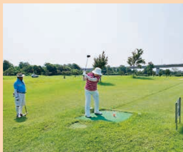
■緑地運動公園(各種ゴルフ場) MAP J-4-5

ケイマンゴルフ場、パークゴルフ場、グラウンドゴルフ場があり、年齢や体力に応じて楽しむことができます。