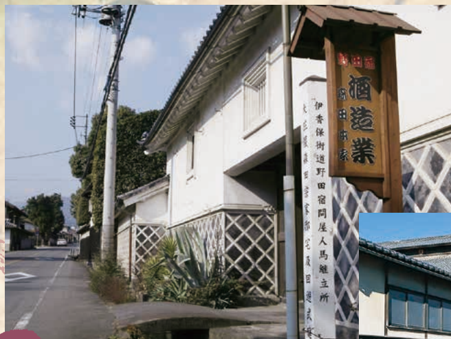
■森田家（野田宿本陣） MAP G-3

本陣の森田家には、細川侯の奥方や、高野長英ら有名な学者や文化人が泊まった記録があります。