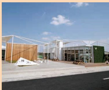
■道の駅よしか温泉 MAP J-4

桃井城址としての歴史性や優れた眺望を活かした誰もが楽しめる大きな公園です。大規模災害が発生した場合の一時避難所にもなります。