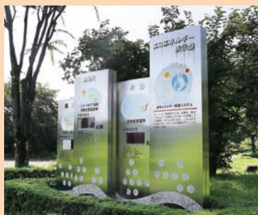
■吉岡自然エネルギーパーク MAP J-4-5

地熱・水力・風力・太陽光の4種類の自然エネルギーを利用した施設が集まるテーマパーク。テーマは「自然環境との調和」