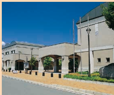
■文化センター MAP H-4