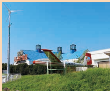
■リバートピア吉岡 MAP J-4

国道17号前橋渋川バイパス沿いに立地。物産館「かざぐるま」では特産品などが販売されています。