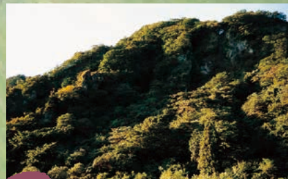
■九十九谷 MAP A-2