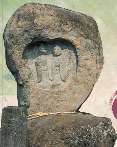
■双体道祖神 MAP G-3