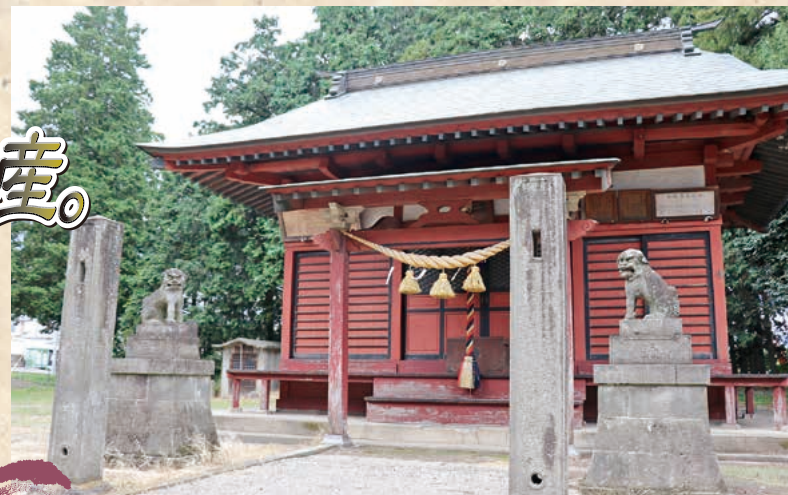
■三宮神社 MAP H-5

本陣の森田家には、細川侯の奥方や、高野長英ら有名な学者や文化人が泊まった記録があります。