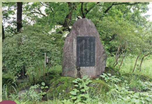
■万葉歌碑 MAP D-2