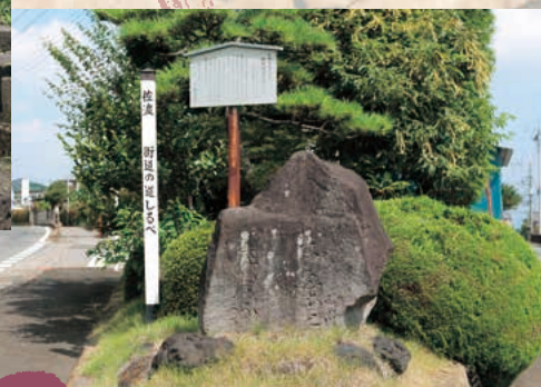
■佐渡街道道しるべ MAP I-5

重久は、日本で2番目の農学書「養蚕育手鑑」を著した養蚕の先導者。墓は県指定史跡。