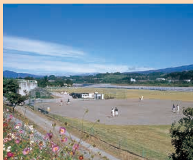
■緑地運動公園(河川敷グラウンド) MAP J-4