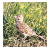
町の鳥 ■ ひばり

天を仰ぐように育つイチョウは、私たちの気持ちを清らかにしてくれるとともに、町の発展を表します。