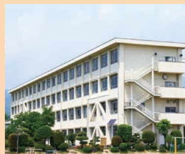
■明治小学校 MAP G-4

教育目標に心身の健康、主体的学習、自他の敬愛を掲げ、社会の変化に対応できる生徒の育成に努めています。