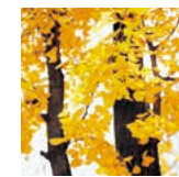
町の木 ■ イチョウ

秋に咲く菊は、格調高い気品と優雅さを誇り、本町の理想を表します。花ことばは、理知・高貴。