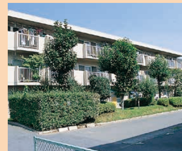
■町営住宅 MAP I-5