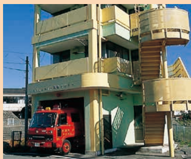
■消防コミュニティーセンター MAP H-4