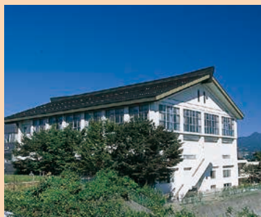
■社会体育館 MAP H-4