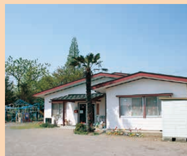
■児童館 MAP H-4

地熱・水力・風力・太陽光の4種類の自然エネルギーを利用した施設が集まるテーマパーク。テーマは「自然環境との調和」