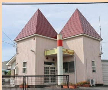
■渋川警察署吉岡町交番 MAP G-4