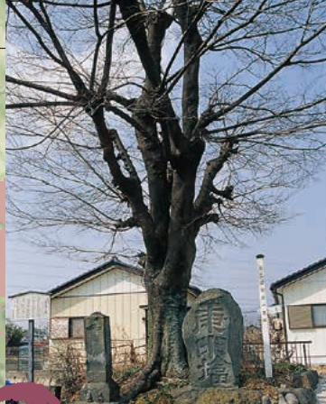
■三国街道一里塚 MAP G-3