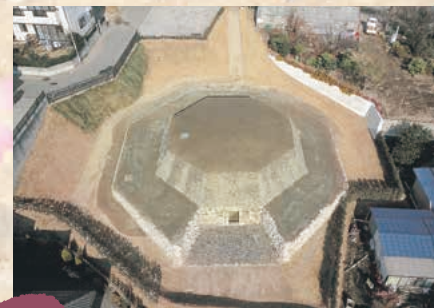
■三津屋古墳 MAP I-5