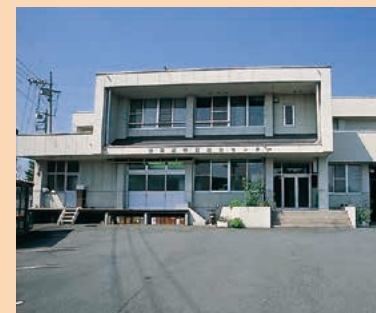
■学校給食センター MAP G-4

大規模校ですが、細やかな指導や高学年学級の副担任制など特色ある学校づくりを目指しています。