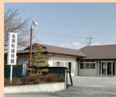
■隣保館 MAP H-3