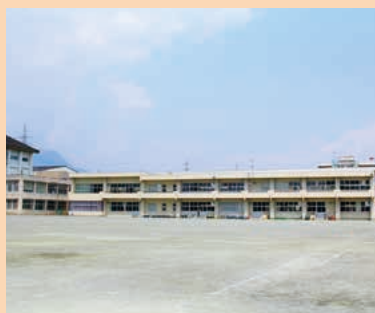
■吉岡中学校 MAP H-4

教育目標に心身の健康、主体的学習、自他の敬愛を掲げ、社会の変化に対応できる生徒の育成に努めています。