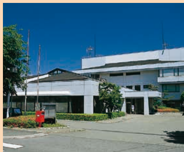
■吉岡町役場 MAP H-4