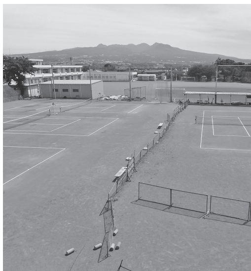
小・中学校の施設開放を考えている (吉中グラウンド)

答 教育委員会事務局 長 小・中学校の体育館やグラウンドの開放を考えている。 問 学校施設利用料は。 答 教育委員会事務局 長 実施主体により無料や安い利用料を検討していく。 問 学校施設や備品の破損・事故が発生した場合の責任は。 答 教育委員会事務局 長 生徒や保護者、指導者が安心して取り組める環境整備が必要と考えている。