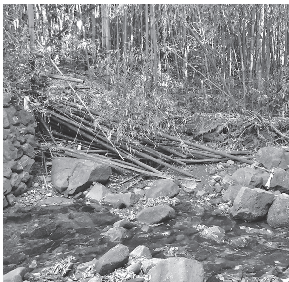
越水の恐れある、竹林の地下茎と石が支える護岸