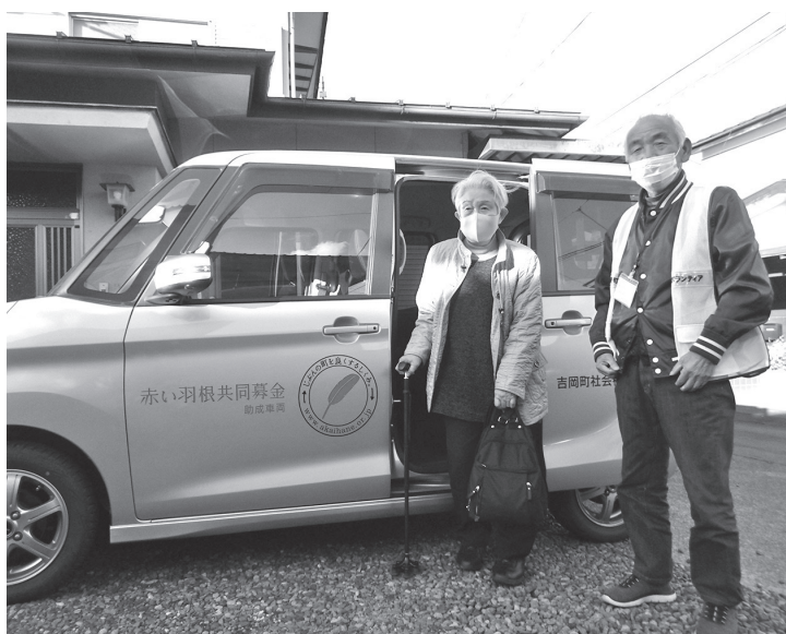
移送サービスの無料化を継続している

教育長 他市町村 で始めていること は承知している。今私 が学校とやりとりし、 意見を聞き、情報を得 ながら決断する中では 今の段階では進められ ないと思っている。