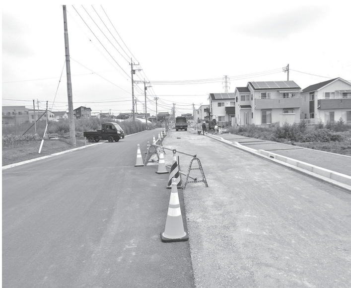
整備が進むジョイフル本田への接続道路

と⑥環境保全に関すること⑦町政情報の発信に関すること⑧その他両者が協議し必要と認める事項に関すること。