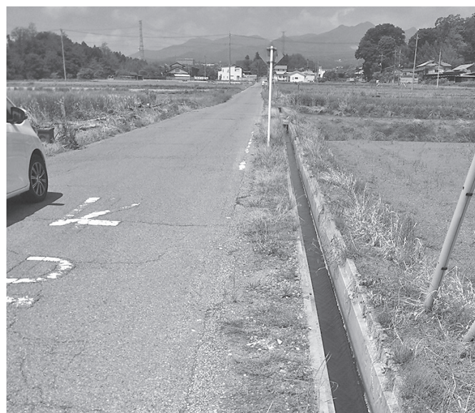
仕事は最後まで、早急な対策を

答 町長 低所得者であるほど収入に占める生活必需品の支出の割合が高くなるため、まずは生活に困窮する人々への支援を先行して実施することを考えている。