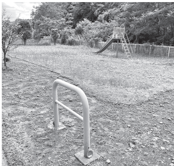
宅地開発によって設置された公園 将来、管理体制が問題となることも

教育委員会事務局 長 食料費が高騰しても、食料の品質を保ち保護者負担を増加させないため、国の臨時交付金などを活用し、円滑に安全な給食を提供できるよう、現在検討している。