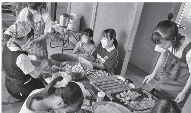
ボランティアは子どもたちのチカラも