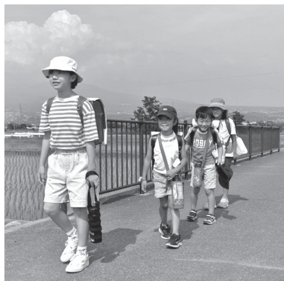
マスクを外して熱中症対策（通学路での小学生たち）

問 学校から保護者や児童に対する発信を、町民をはじめ、われわれ議員にも伝えてほしいが。