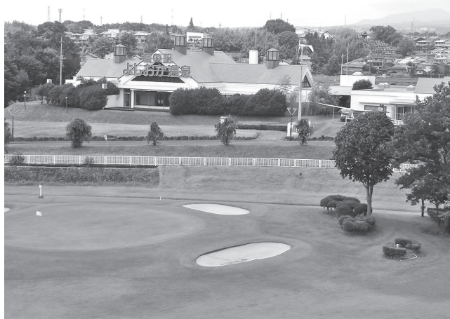
新体制での改革が期待される (よしおか温泉リゾートピア吉岡)

答 野外で3密を避けて、また休日には家族連れも訪れ楽しめる優位性がある。さらなる利用者増は、振興公社と町と一緒に検討していきたい。