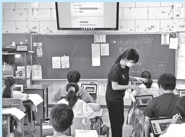
情報端末と大型テレビを使用した授業