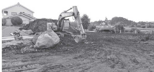
工事が始まった明治第2学童クラブ