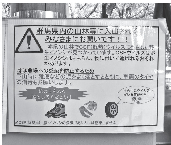
船尾自然公園バーベキュー広場にも掲示

の表示を行い、感染防止への協力をお願いと併せて、正確な情報を発信することで風評被害の抑止に努めていきたい。