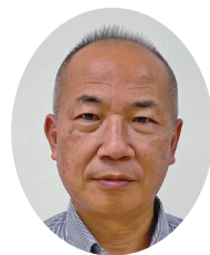
吉岡町第四保育園 園長