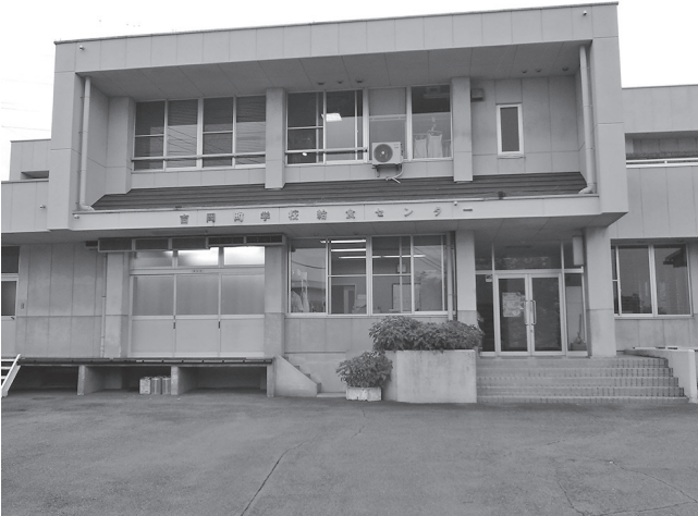
昭和63年の建設から33年経過しており老朽化が進んでいる(学校給食センター)