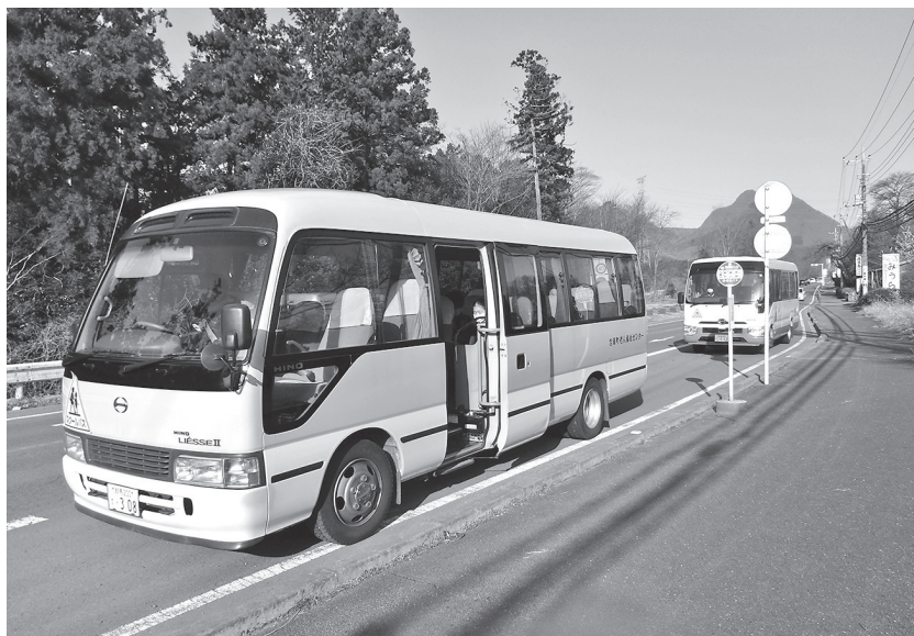
2学期から利用者 24 人（通学バス）

平成20年2月8日に渋川市・榛東村・吉岡町として協定書を締結。 平成23年3月以降に一般廃棄物最終処分場の設置に当たり、協議の結果、協定書を作成。 内容は5項目で、1、埋め立て期間は原則として15年間。2、用地選定順序は①渋川市②吉岡町③渋川市④榛東村。3、提供用地は、一般廃棄物処分場として関係法令などに適合する用地。4、埋め立て終了時は、跡地利用など十分考慮し、最終覆土と転圧を十分行う。5、浸出水処理施設は、公害の発生が皆無であることが確認された後、撤去するものとする。