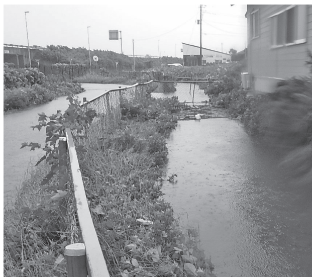
どちらが水路か分からない冠水した道路（左）、溢れた状態の漆原用水路（右）