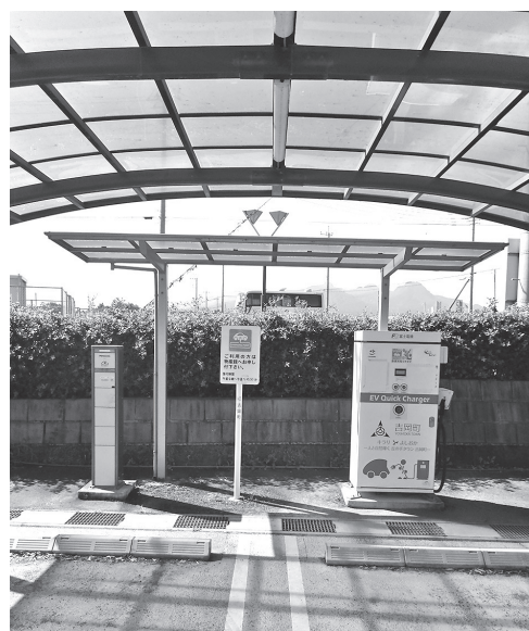
現在無料のEV充電器