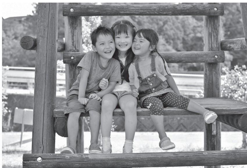
コロナ禍の中で、子どもたちが将来に希望が持てる支援を