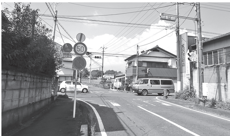
いまだに安全対策が取られていない（田中交差点）

7カ月間で16件の事故 があり12人が負傷して いる。いまだに何の対 策も取られていないが。