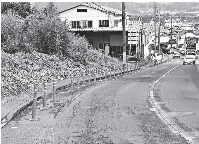
ポストコーンでは安全対策が不十分（長松寺北の町道）