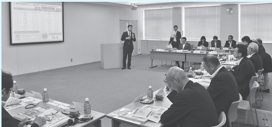
町長より「健幸づくりプロジェクト」の説明を聞く（境町）