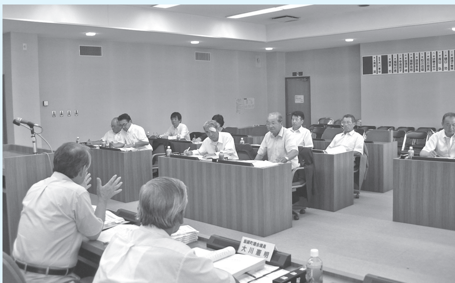
議長から議会改革のポイントを学ぶ（飯綱町）

飯綱町議会では1期目議員への学習会の実施を始め、議会改革の内容を町民に宣言し、目標達成に向け取り組んできたとのことでした。議会改革で一番大切な改革は、議員それぞれの意識改革が重要とのことでした。議員それぞれの意識改