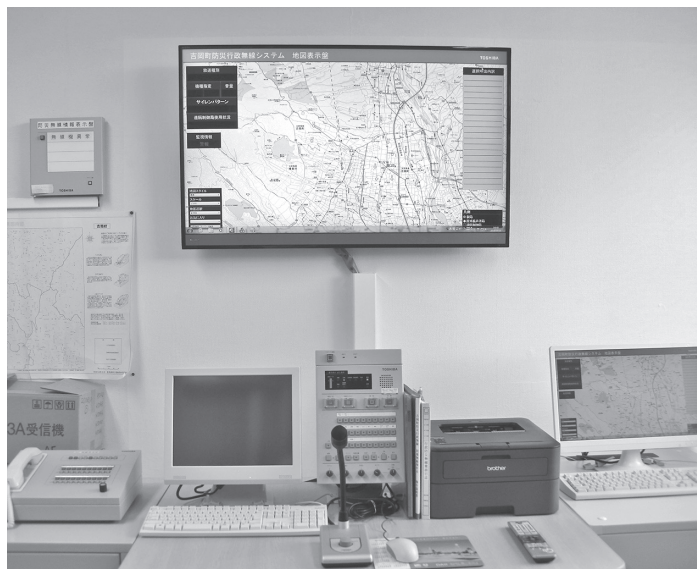
デジタル化への更新が進む防災無線システム（役場庁舎）