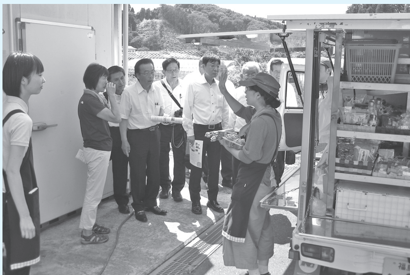
農福連携事業に取り組む「こころん」で移動販売の説明を受ける

7月24日、宮城県仙台市の一般社団法人リルートで、被災農家の野菜販売・地元企業と連携したレトルトカレーの商品化などの取り組みを視察しました。 東日本大震災で始まった大学生主体のボラ