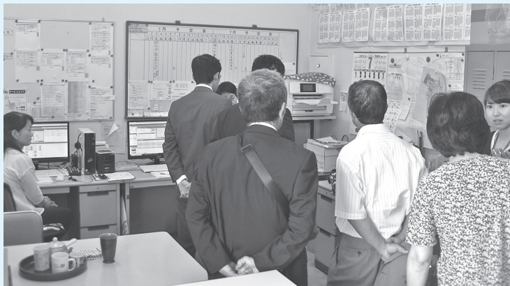
デマンドタクシーの運用状況を学ぶ（芳賀町）

芳賀町は、平日、土曜、祝日に運行。日曜、年末年始は運休。大人200円子ども100円。両町とも、事前に予約センターか町の担当課に登録し、予約センターに連絡して町内と町外2施設を、芳賀町は車3台と茂木町は4台で運行しています。また、70代80代の女性による医療機関と商業施設へ