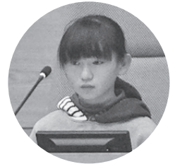
3人の議長が交代で議事を進行しました