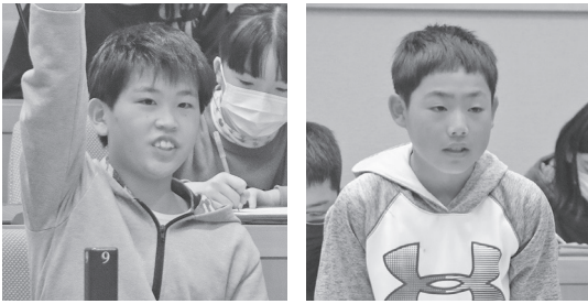
代表児童15人が真剣な眼差しで町政について質問