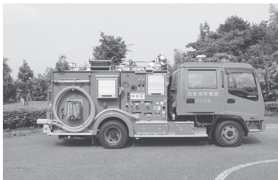
制度の活用が待たれる水槽付き消防車