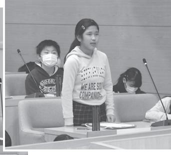
代表児童 16 人が真剣な眼差しで町政について質問しました