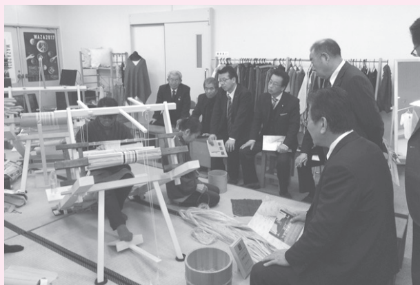
麻織物の伝統技術を学ぶ（愛荘町）