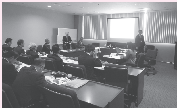
阿久比町での研修