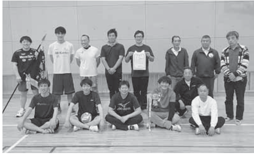
男子優勝 漆原東自治会

令和4年度町民バレーボール大会(自治会対抗) 5月8日(日) 男子 優勝 漆原東自治会 準優勝 上野田自治会 第3位 漆原西自治会、溝祭自治会 女子 優勝 漆原西自治会 準優勝 下野田自治会 第3位 上野田自治会、北下自治会