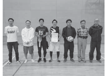
男子準優勝 上野田自治会