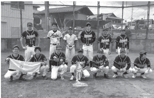
準優勝 川西レパーズ