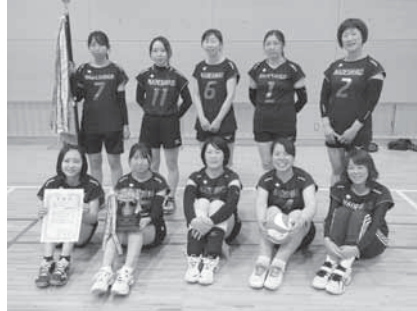
女子優勝 漆原西自治会