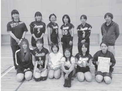
女子準優勝 下野田自治会

令和4年度町民バレーボール大会(自治会対抗) 5月8日(日) 男子 優勝 漆原東自治会 準優勝 上野田自治会 第3位 漆原西自治会、溝祭自治会 女子 優勝 漆原西自治会 準優勝 下野田自治会 第3位 上野田自治会、北下自治会