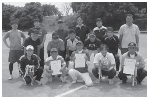
上位3チームの皆さん

第36回町民熟年ジョイフル スローピッチソフトボール大会 6月5日(日) 優勝 大久保寺上自治会 準優勝 大久保寺下自治会 第3位 陣場自治会 優勝した大久保寺上自治会 は、7月実施予定の広域大会 へ派遣予定です。