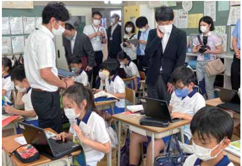
4年生の国語の授業。タブレットを使いこなす子どもたち