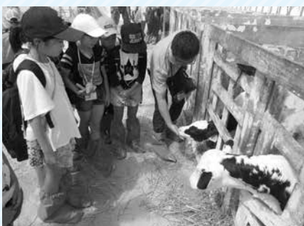
昨年の体験学習の様子