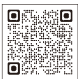
▲詳しくは町ホームページをご覧ください