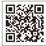
▲国保離脱の手続きはこちらから