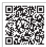
▲厚生労働省「労働保険料等の口座振替納付」