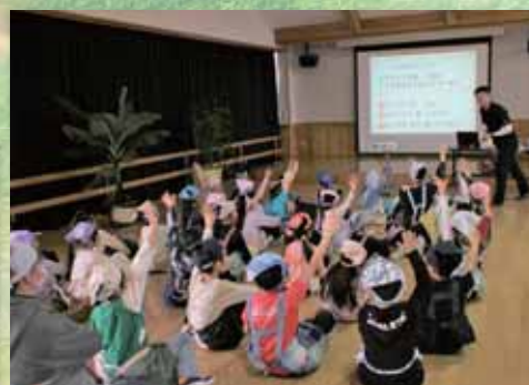
このコーナーでは友好都市大樹町の魅力を町民の皆さんに紹介します。